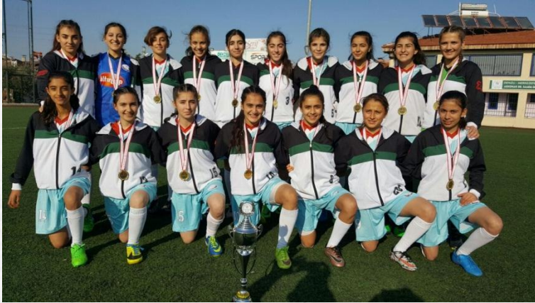
Genç Kızlar Futbol Takımı İl Birincisi