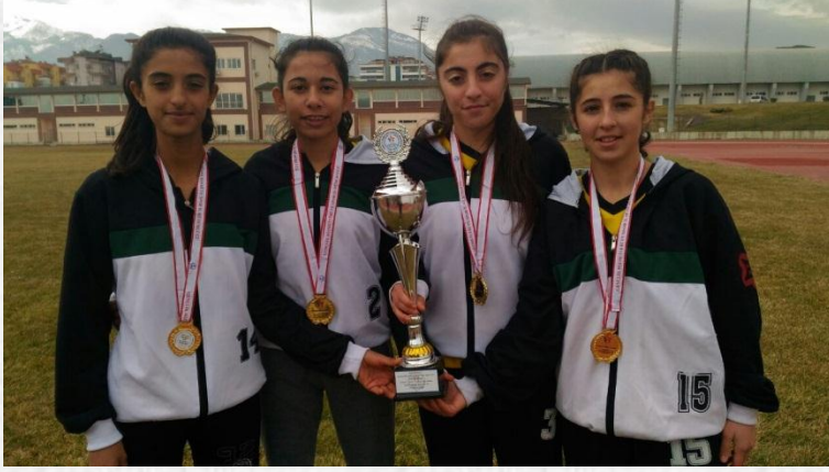
Genç Kızlar Kros Takımı İl Birincisi